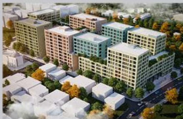
PLANI I VENDOSJES SË OBJEKTEVE